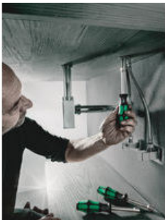
Hohlschaft für überstehende Gewindestangen