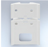
Including corner wall mount bracket