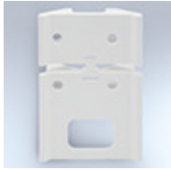
Including corner wall mount bracket